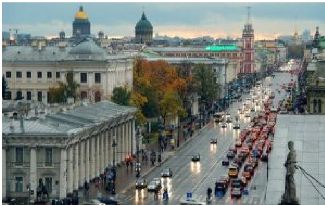
Невский проспект.

Все, кто хоть раз побывал в Санкт-Петербурге, обязательно прогуливались по Невскому проспекту – главной улице Северной столицы. На протяжении всех 4,5 км сосредоточено огромное количество красивейших достопримечательностей города. Это и величественный Казанский собор, и Аничков мост со знаменитыми «укротителями коней», и роскошный магазин в доме купцов Елисеевых, и множество других впечатляющих мест. Неудивительно при такой концентрации культурных объектов, что Невский проспект входит в список Всемирного наследия ЮНЕСКО . Это «сегодня», а что было с Невским «вчера»?