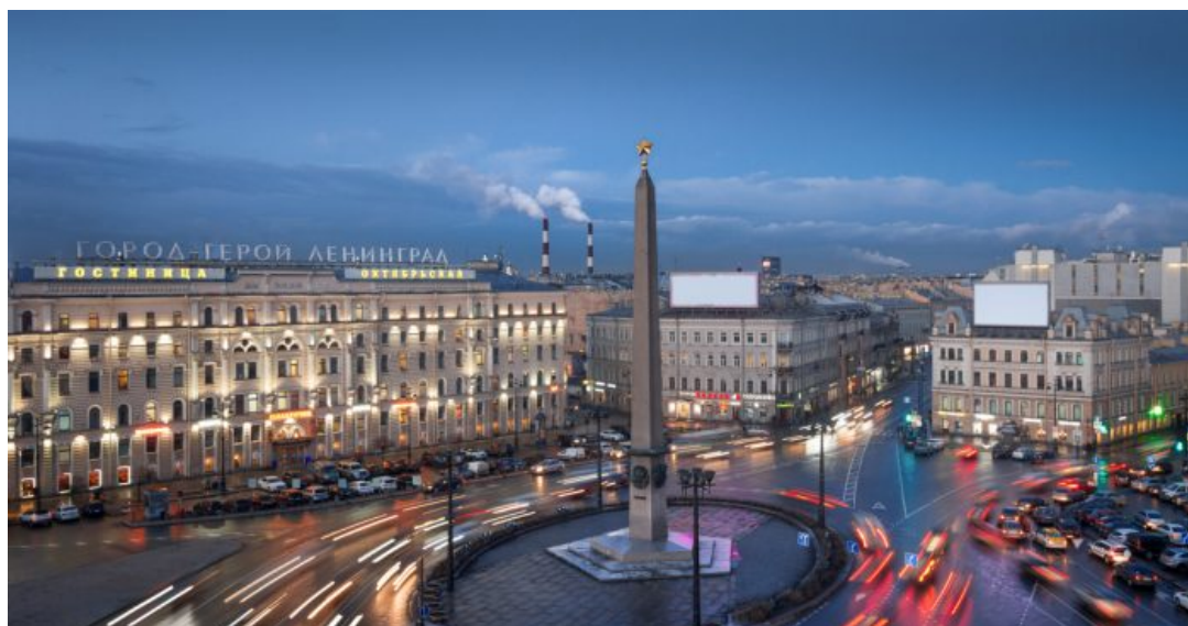
Площадь Восстания.