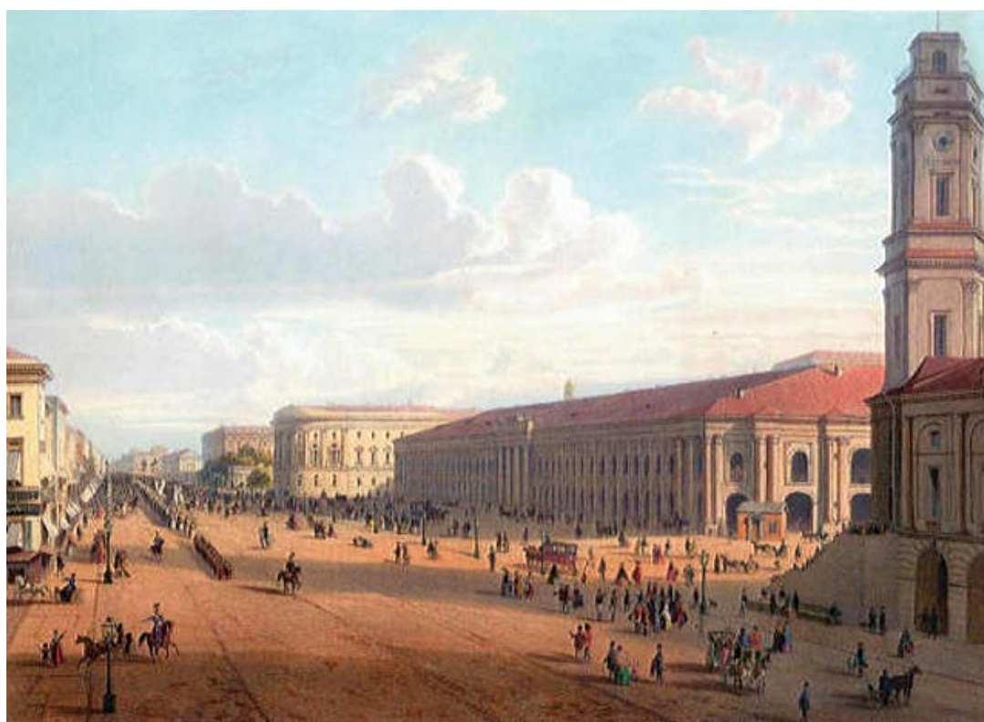
Невский проспект у Гостиного двора. Литография Ж.Жакотте. 19 век.

Облик проспекта сложился к началу 19 века.