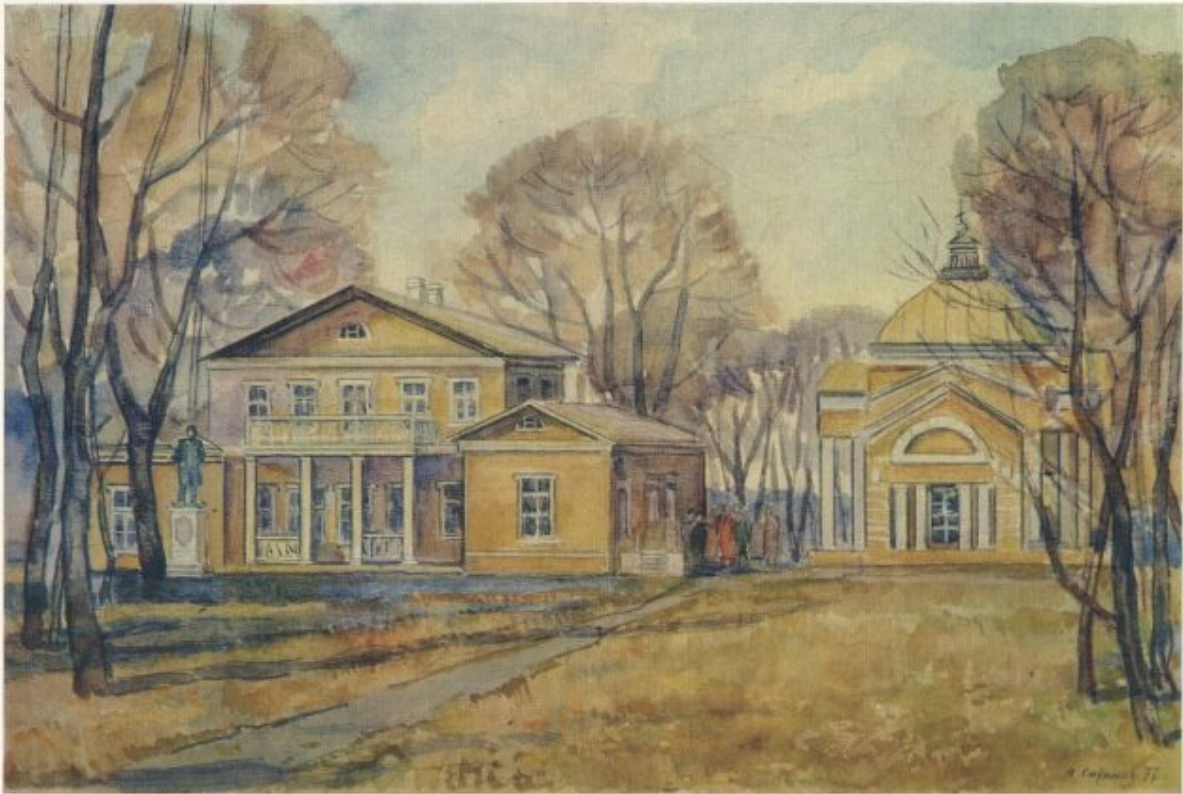
1 А. И. САХАНОВ. Род. 1914 г. Тарханы. Усадьба Е. А. Арсеньевой, бабушки поэта. 1977

© Издательство «Советский художник». 1978 г. Изд. № 12-925/р. 11,5 л.